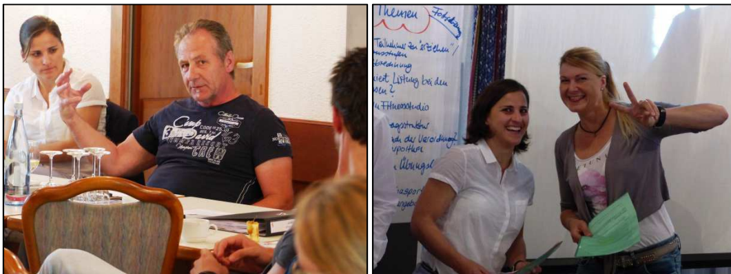
Die Teilnehmer brachten Erfahrungen ein, trugen Anliegen vor und hatten dabei sichtlich Spaß

Tanja Stiber stellte anschließend in einem kurzen Impulsvortrag das Konzept der Rehasport-Sprechstunde vor. Diese Thematik stieß bei den Teilnehmern auf reges Interesse. Mit den eingebrachten Informationen im Umgang mit Rehasportlern entwickelte sich durch die kompetenten Beiträge und Erfahrungswerte der Einrichtungen sowie der Moderation durch Winfried Möck eine rege Diskussion, die zahlreiche Anregungen für die Durchführung der Rehasport-Sprechstunde und Ansätze zur Kundenbindung hervorbrachte.