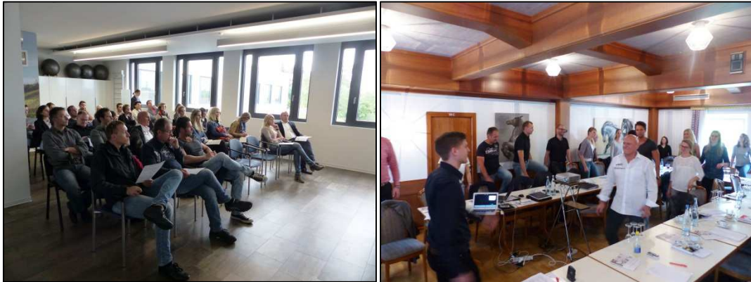
Die Netzwerkpartner im Gesundheitsrondell und während der aktiven Pause

Das Netzwerk der Gesundheits- und Rehasportvereine hofft viele bekannte sowie neue Gesichter beim nächsten Netzwerktreffen im Herbst 2016 begrüßen zu dürfen und freut sich schon jetzt auf die zahlreichen Erfahrungen und Fragen, die die Teilnehmer zum nächsten gemeinsamen Austausch mitbringen werden.