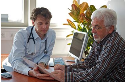
Beratung eines Rehasport-Teilnehmers im Rahmen der Rehasportsprechstunde

Viele unsere Partnereinrichtungen kennen das Konzept der Rehasport-Sprechstunde von den Netzwerktreffen oder aus der Basis-Schulung.